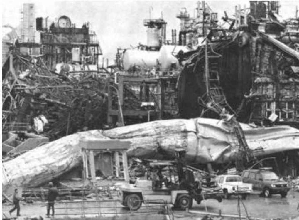
Skikda, incendio 2004.

TV e giornali, negandoti un'informazione a 360° sul discorso rigassificatore, riducono la possibilità di un tuo ponderato giudizio. Quella che segue è l'informazione che non Ti viene comunicata.